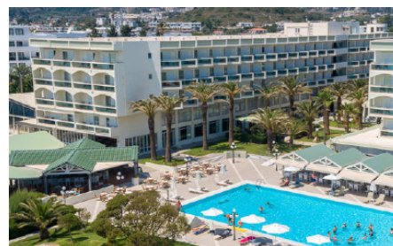
Unser Hotel Apollo Beach

Wir möchten Sie zu einer ganz besonderen Reise einladen. Entdecken Sie mit uns die Vielfalt der Insel Rhodos auf unseren tollen und abwechslungsreichen Ausflügen mit unserem Reiseleiter Andreas. Das am langen Sand-/Kiesstrand von Faliraki gelegene Hotel Apollo Beach besticht durch seine Atmosphäre.