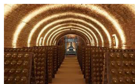
Besuch der Sektkellerei Schlumberger

Fahren Sie mit uns gemütlich mit dem ÖBB Zug in unsere schöne Bundeshauptstadt Wien. Die Stadt der Musik und Kultur lädt uns ein, die faszinierende Eisrevue zu besuchen und das schöne Rahmenprogramm zu genießen.