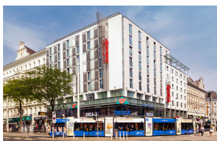
Unser Hotel Intercity