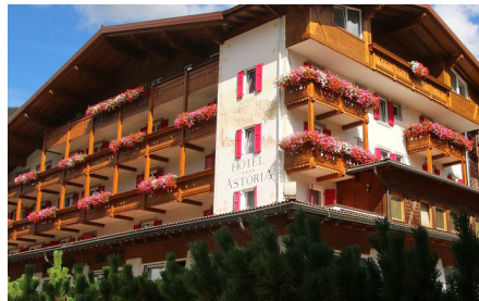
Unser Hotel Astoria