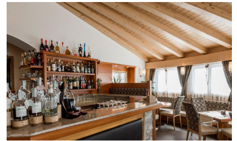
Gemütliche Hausbar lädt zu einem Drink ein

In Canazei im Talschluss des Fassatals- einer der ladinischen Täler umgeben vom imposanten Dolomitengebirge liegt unser Wanderhotel. Genießen Sie mit uns eine herrliche Wanderwoche im Fassatal.