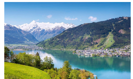
Schiffahrt auf dem Zellersee

Fahren Sie mit dem Seniorenbund nach Mariazell im nordsteirischen Alpengebiet. Der Ort ist das wichtigste Mariaheiligtum in Österreich. Die zweite Nacht verbringen wir im Schützenhof in der Flachau. Auf der Heimreise machen wir noch eine schöne Bootsfahrt auf dem Zeller See mit einem traumhaften Ausblick auf die schöne Bergkulisse.