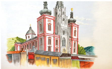
Kirche von Mariazell