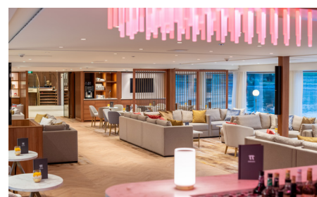
wunderbarer Panorama Salon

In neun Tagen fahren Sie von Basel nach Amsterdam und wieder zurück. Dabei durchqueren Sie vier Länder und entdecken atemberaubende Landschaften und viele interessante Orte. Sie übernachten in luxuriösen Kabinen, dinieren im exklusiven Schiffsrestaurant und können im Panorama Salon mit Blick auf die vorbeiziehende Natur die Seele baumeln lassen.