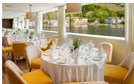
Restaurant auf der MS Thurgau Gold