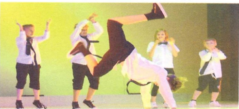
Kindertanzgruppe Dance Hall