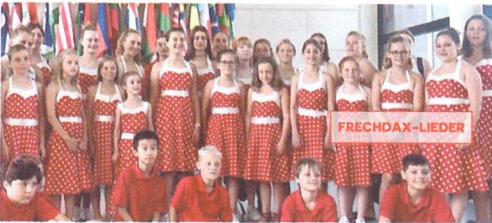
Kinderchor Götzis, Frechdax & Calypso