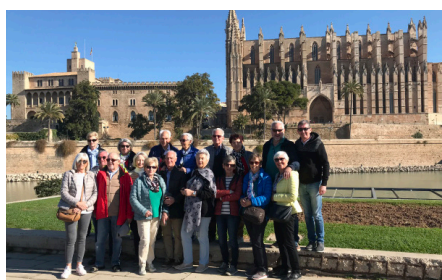
Kathedrale von Palma