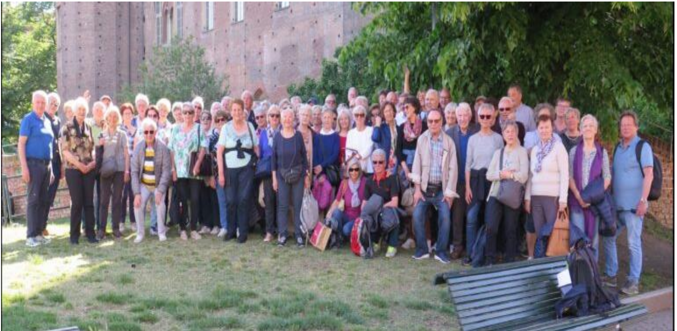
87 Teilnehmer in Turin

Es war eine wunderbare Frühjahrsreise mit den Zielen Piemont und Turin. Die Führungen, die Panoramafahrten, die Kulinarik, ja das italienische Flair, und dies bei bester Witterung, begeisterte die 87 Teilnehmerinnen und Teilnehmer.