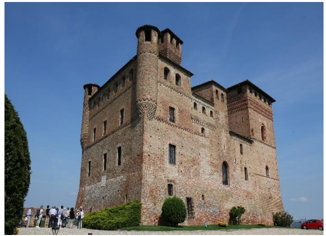
Schloss Grinzane Cavour