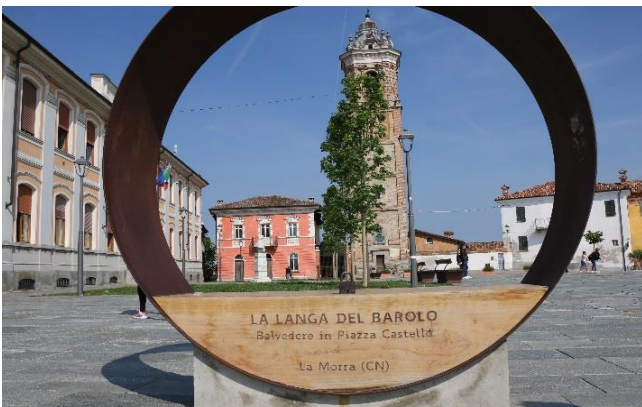
La Langa del Barolo