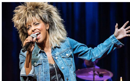
Tina Turner Simply the Best