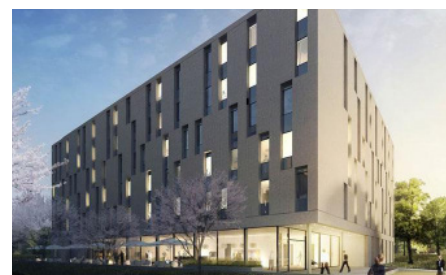
Hotel Ibis Styles Vahingen

Erleben Sie mit uns Simply The Best in Stuttgart und besuchen Sie das Musical Tina Turner. Tina Turner Fans können sich nun noch einmal auf eine Zeitreise durch fünf Jahrzehnte Musikgeschichte der Powerfrau begeben und deren größten Hits live erleben. Weiters haben Sie die Möglichkeit am 2. Tag den Weihnachtsmarkt in Stuttgart zu besuchen.