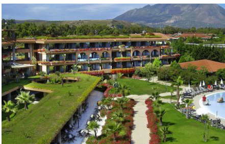
Unsere Hotel Acacia Resort