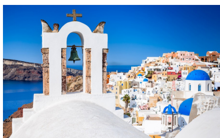
Oia mit seiner bekannten Kapelle