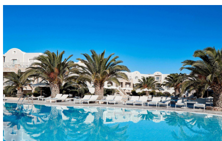
Unser Hotel Santo Miramare Resort