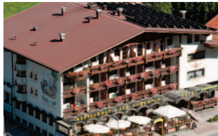
Unser Hotel Hubertus