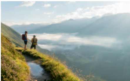
Wanderidylle im Ötztal