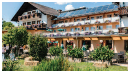
Unsere Unterkunft Trattnerhof