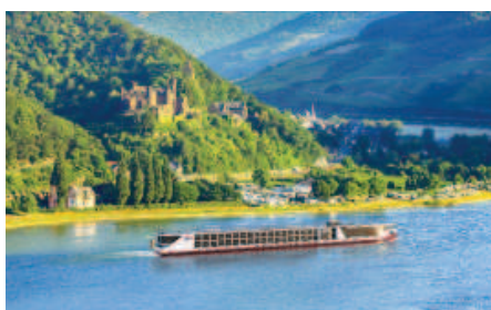
die neue Nicko Spirit