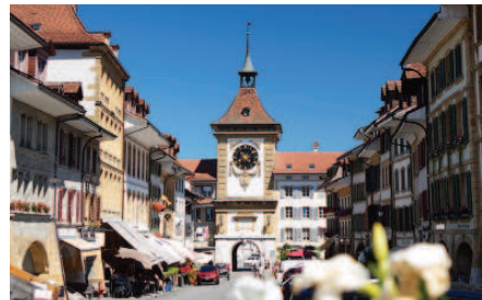
Marktplatz von Murten